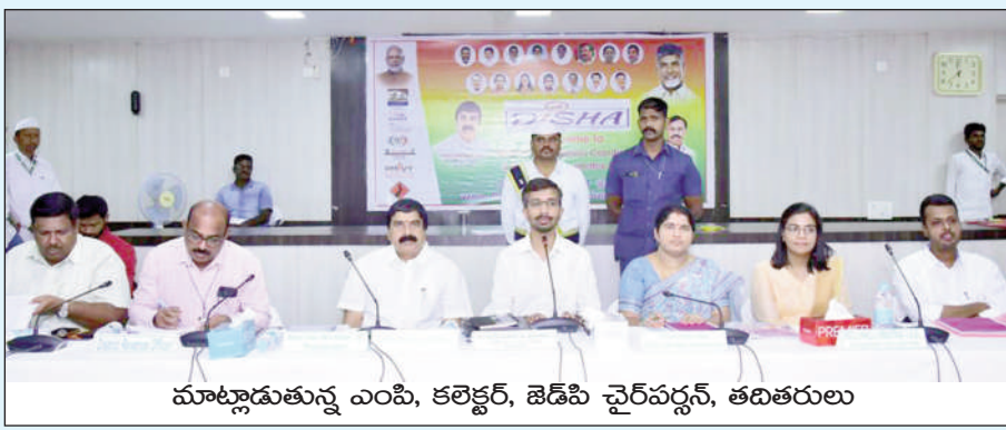
మాట్లాడుతున్న ఎంపి, కలెక్టర్, జెడపి చైర్మన్, తదితరులు