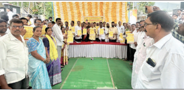
సభ్యత్వ సమోదయ దృశ్యం